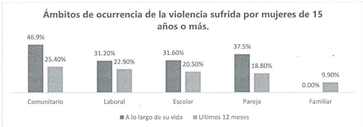
Gráfica 2 Fuente INEGI. Encuesta Nacional sobre la Dinámica de las Relaciones en los Hogares (ENDIREH) 2021. Tabulados Básicos.

La prevalencia de al menos un incidente de violencia (de cualquier tipo a lo largo de la vida) de las mujeres de 15 años y más en Quintana Roo muestra que aquéllas que experimentan mayor violencia son: las que residen en áreas urbanas (73.2 %), de edades entre 25 y 34 años (77.5 %), con nivel de escolaridad superior (79.2 %), que se encuentran solteras (74.3 %) y las que no hablan una lengua indígena y no se consideran indígenas (75.3 %).