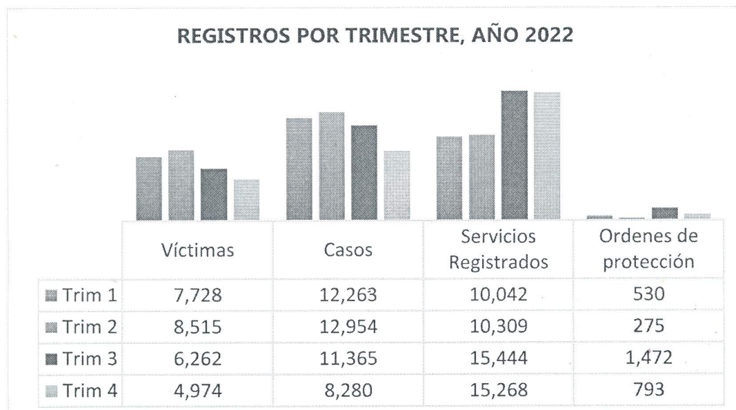
Gráfica 3 Elaboración propia SSP (BAESVIM)

De acuerdo a los datos publicados en el informe BAESVIM, se documentaron los siguientes registros de manera trimestral, en los cuales puede observarse una reducción en el número de víctimas ingresadas por trimestre, pero considerando que éste proceso obedece al reconocimiento de nuevas víctimas, se establece que la información del comportamiento de los casos de violencia, debe analizarse al nivel del registro de casos, el cual corresponde al número de activaciones de las instituciones de primer contacto en la atención a la víctima, así como, en el número de servicios proporcionados a la víctima los cuales determinan la serie de acciones que fueron proporcionadas en la atención a la víctima.